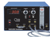
SAR-830A 小動物用ベンチレータ