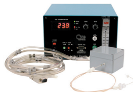
Capstar100 呼気CO 2 アナライザー