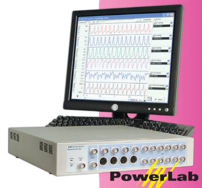
データ収録・解析のゴールドスタンダード

ML846 PowerLab4/26、ChartProソフトウェア、デュアルバイオアンプ、筋電図電極、標準アンプ、心音マイクロフォン、サーミスタポッド、鼻の呼気温度測定用プローブ、ピエゾ呼吸ピックアップ、ビデオカメラ、コンピュータ